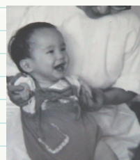
※写真は、ご本人が幼少時のものです。

ことはないと思っています。力強く生きることで苦難を乗り越えるしかないのです。このサリドマイドが、現在、再び認可され使われています。多発性骨髄腫という血液のがんやハンセン病の症状に効果があることが分かったためです。薬そのものが悪いのではない——二度と同じような被害を起こさないために、この薬の危険性をよく知って、慎重に使用してほしいと思います。